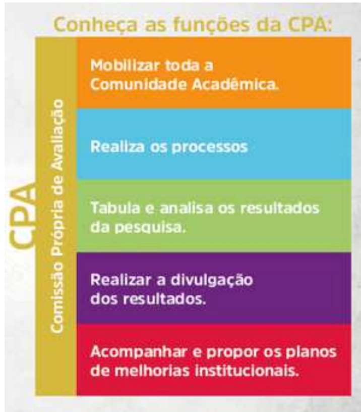
Quadro 3 – Funções CPA