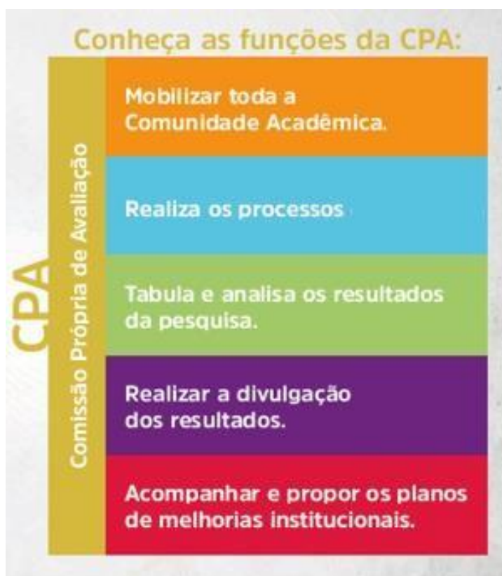
Figura 3 – Funções CPA