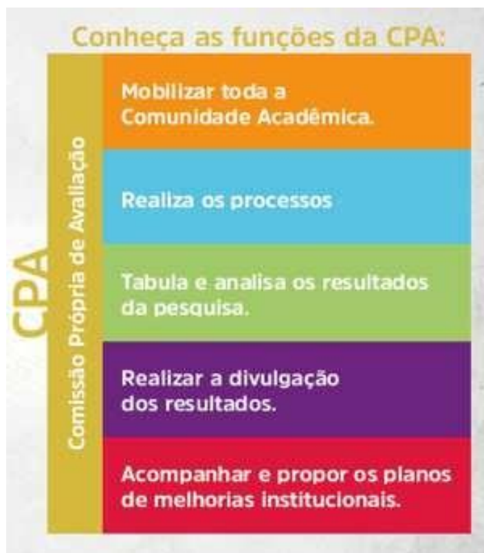
Quadro 4 – Funções CPA