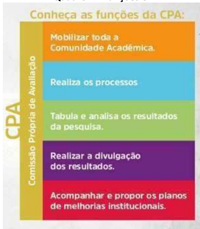
Quadro 4 – Funções CPA